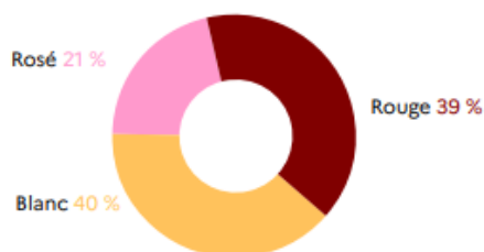
Part de la production par couleurs en 2023

L'année 2023 symbolise cette nouvelle donne du vin , avec une production de vin blanc dépassant pour la première fois celle du vin rouge , perçu par le consommateur comme trop fort, tannique et alcooléux.