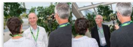
ICI TÉMOIGNAGES G. Aubril / H. Pluyaut