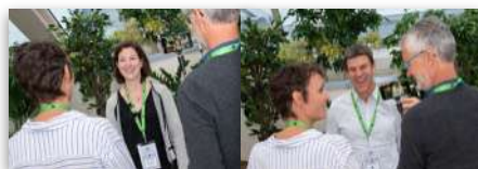
ICI TÉMOIGNAGES C. Sibout / T. Minard