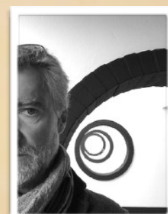
Olivier LEGUISTIN Coordination, réalisation